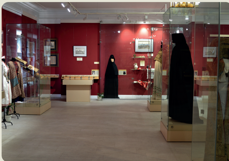
Музей Казанской епархии

Затем перед нами открылись двери Музея Казанской епархии. И – о чудо – сохра-