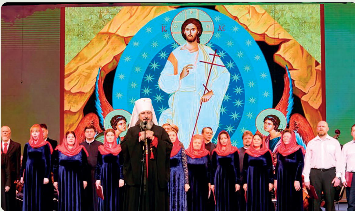
Большой Пасхальный концерт