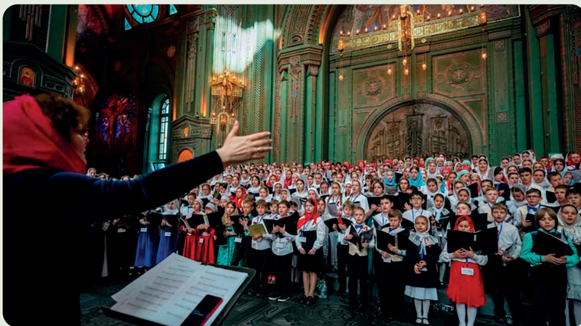
Поёт Детский Победный хор