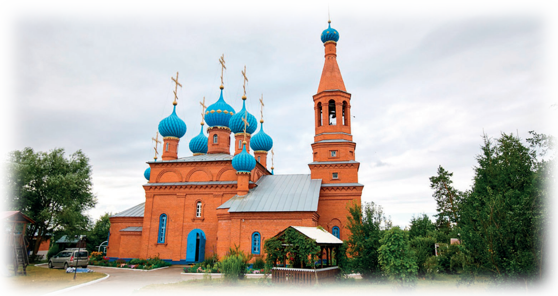
Храм Покрова Пресвятой Богородицы с. Калинино

полагает, там же всё пронизано молитвой, с утра до вечера. Люди молятся постоянно, и работа идет. Духовная жизнь на первом месте. Он говорил: «А у нас, у мирских, для Бога вообще нигде места не было».