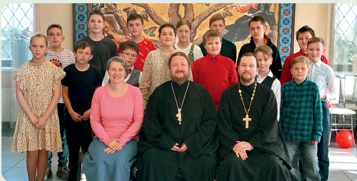
Слёт юных алтарников, чтецов и певцов