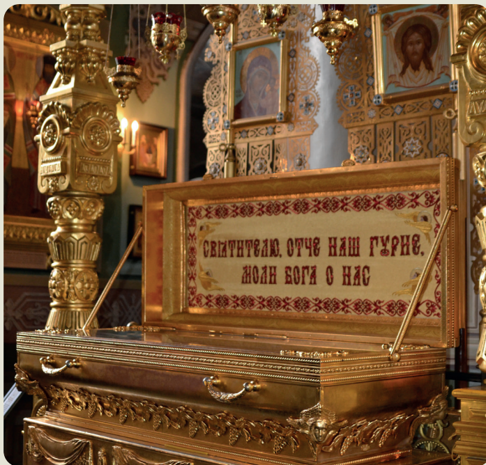
В Благовещенском соборе

Казанский кремль, Благовещенский собор – духовная твердыня края. Поволжье естественно вбиралось Русским государством не как завоёванная территория, а как составная часть знаменитого торгового пути по великой реке «из варяг в персы». Понимание значимости присоединения Казанского края показало государственную зрелость царя Иоанна Васильевича и мудрость