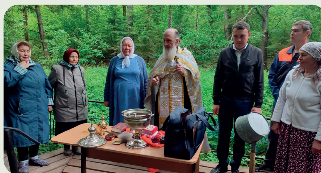
Освящение источника в д. Кошмаш-Тойси