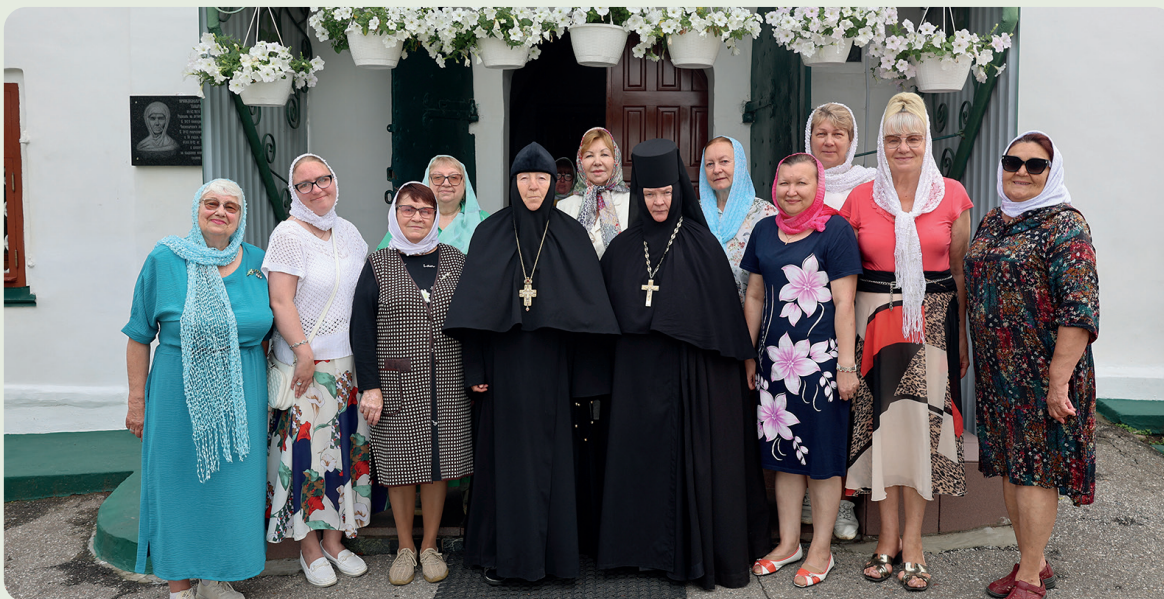
Члены «Союза православных женщин» в день святой равноапостольной Ольги