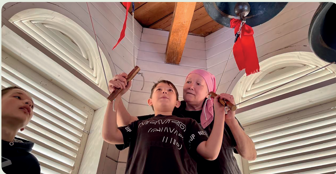
Воспитанники Центра социального обслуживания на колокольне в Иверском храме