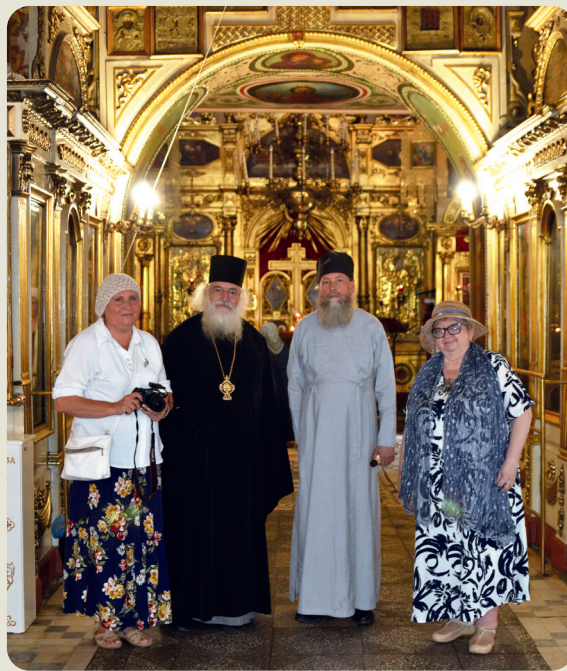
Паломники в храме Ярославских чудотворцев

Дальше наш путь лежал на Арское кладбище, историческое место для потомственных казанцев. Здесь нас встретил про-