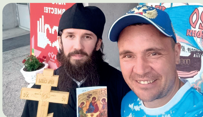
Миссионеры на улицах Алатыря