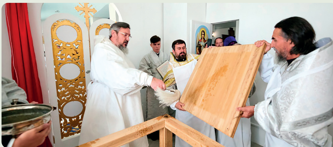
Освящение придела Николая Чудотворца в Казанском храме г. Цивильска