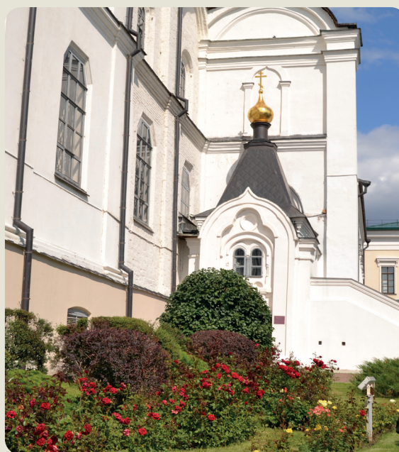
Келья святителя Гурия