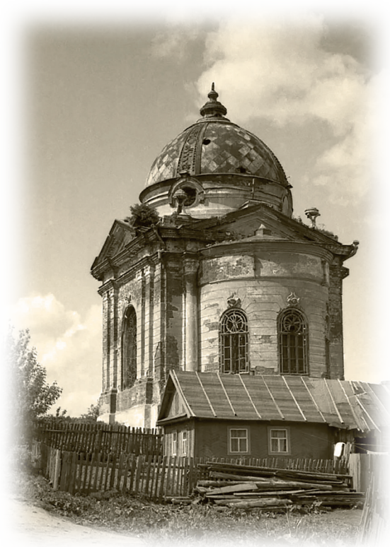
Усыпальница Ефремовых, ныне храм святого праведного Иоанна Кронштадтского