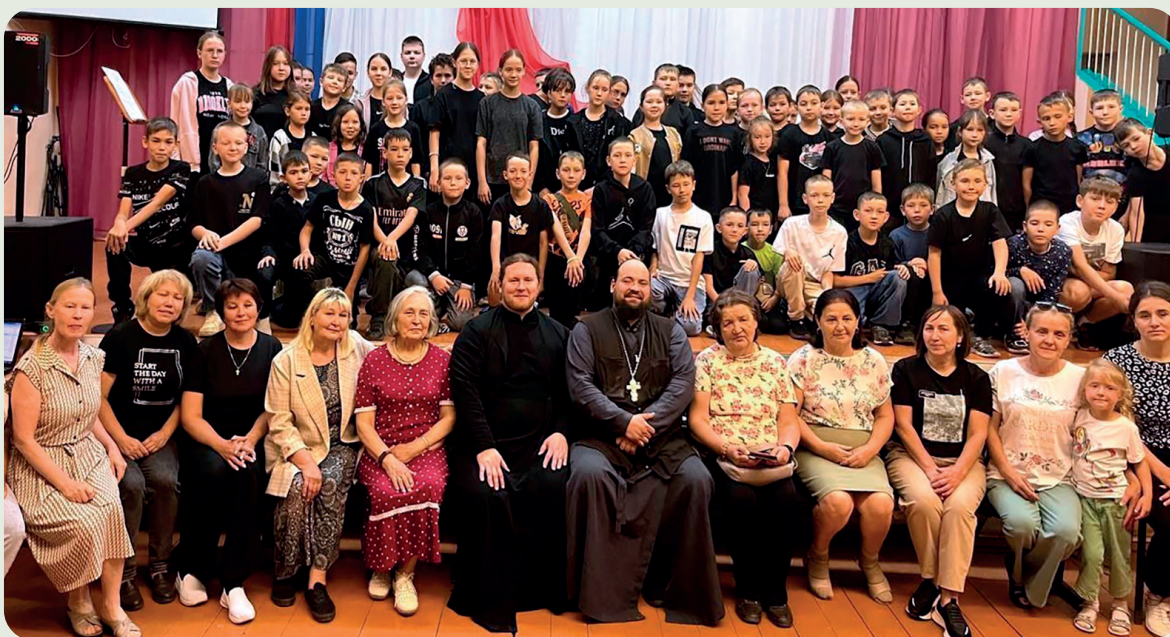
Разговоры о важном