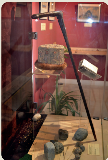
Посох святителя Гурия

сейчас восстановлен, благоукрашен. Это настоящая жемчужина Казани.