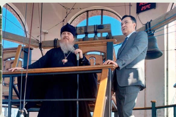
Главный федеральный инспектор Григорий Сергеев в Свято-Троицком монастыре