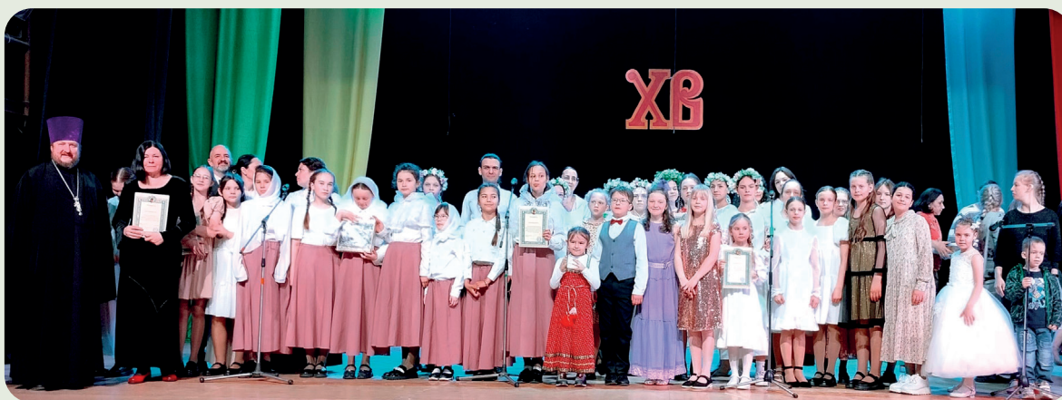
Пасхальный фестиваль «Радость моя»