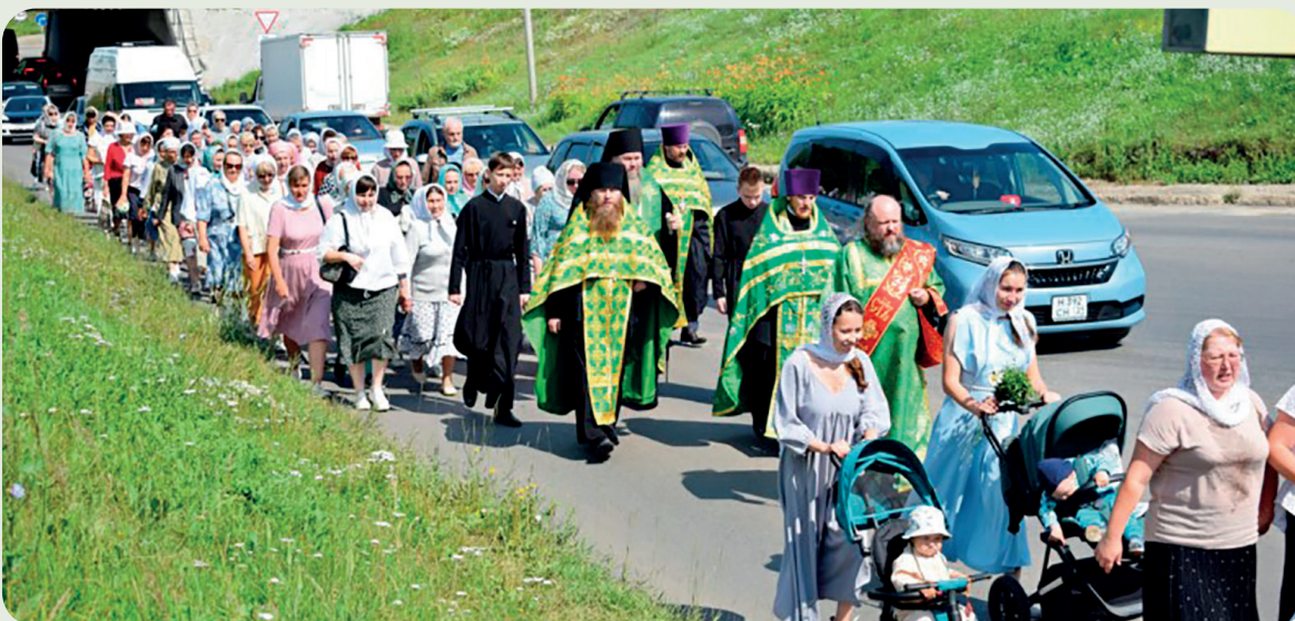
Крестный ход в день Петра и Февронии