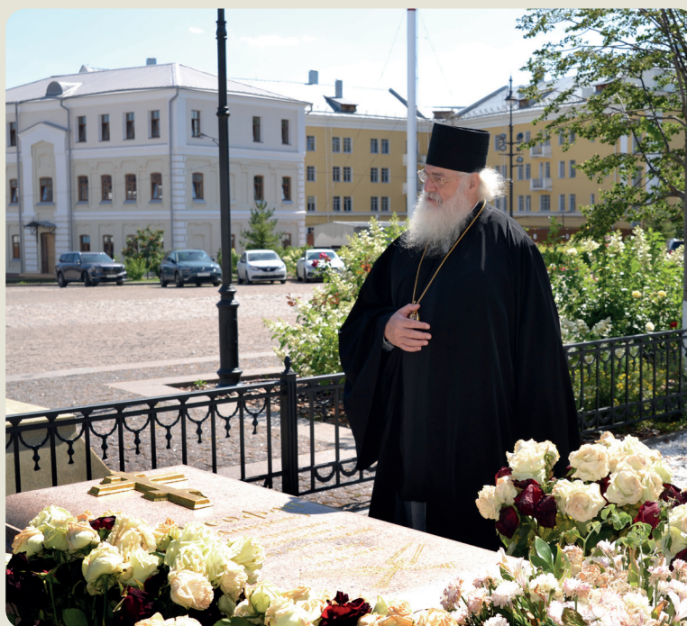
В Казанско-Богородицком монастыре