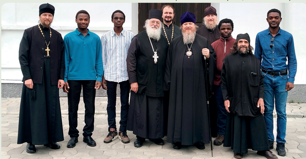
Африканские студенты в Алатыре