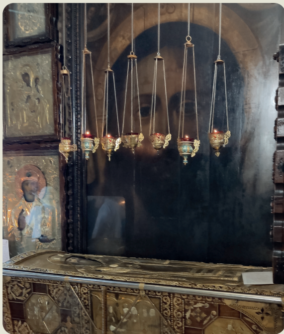
Рака с мощами святителя Гурия

пристроенной к стене собора, молился он в свои последние земные дни. В этой келье пропели величание святителю участники нашей экспедиции архимандрит Василий (Паскье) и протоиерей Евгений Давыдов, а мы смиренно замерли в этих священных стенах. В самом соборе поклонились частице мощей святителя Гурия.