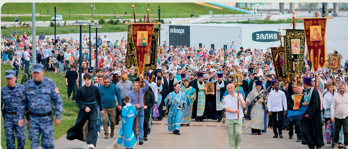
Владимирский крестный ход