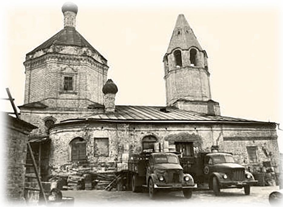
Каменный монастырский храм в разные годы использовался под бондарный цех, склад стройтреста. Фото 1960-х годов

реставрационные мастерские Министерства культуры Чувашской АССР.