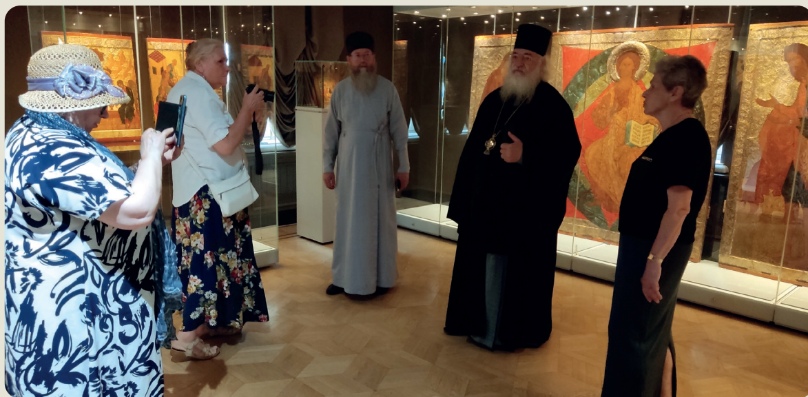
Выставка икон в музее изобразительных искусств

Казань достойно встречает год 470-летия основания епархии. Нашу небольшую