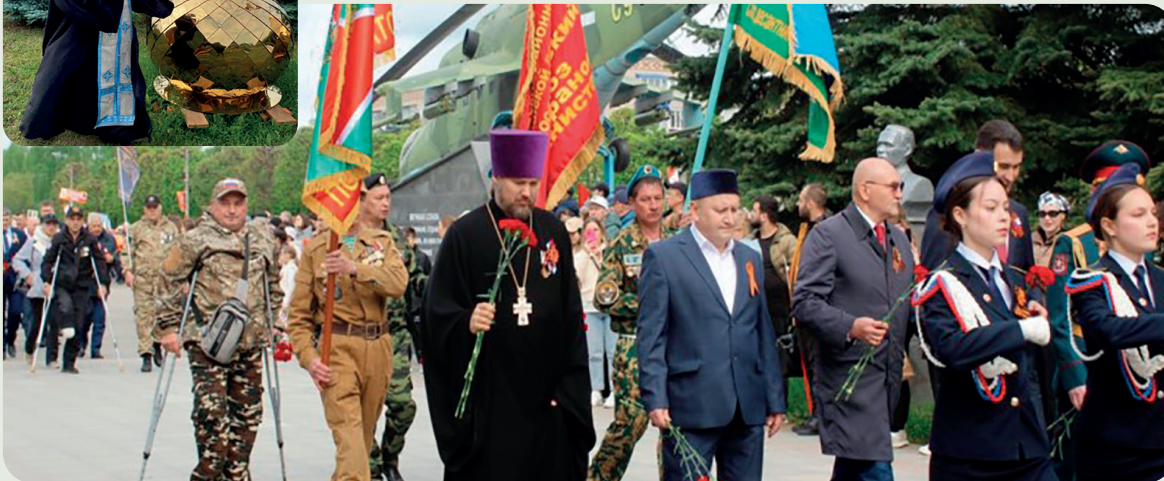
День Победы в Канаше